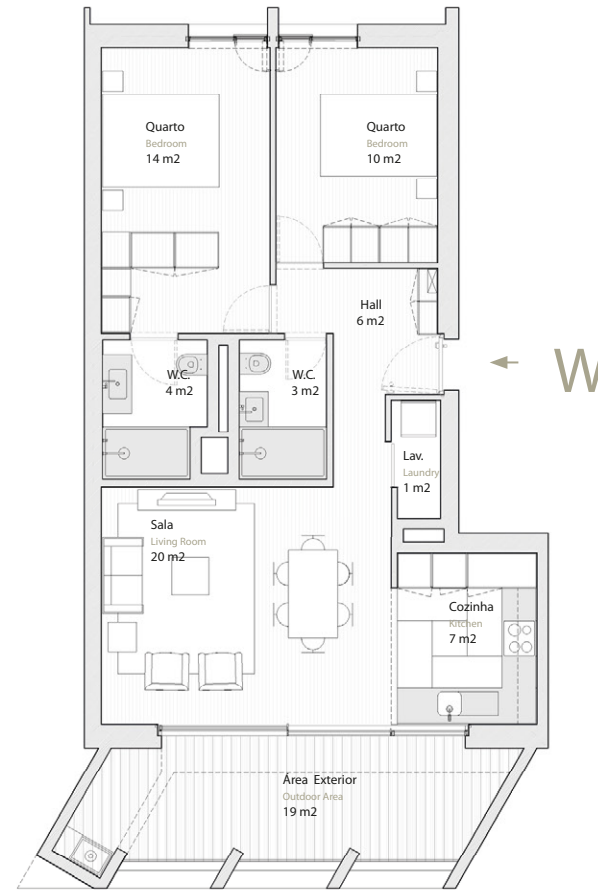
Vista Parque Green Park View

Estacionamento Parking 1 lugar (-1) Spot