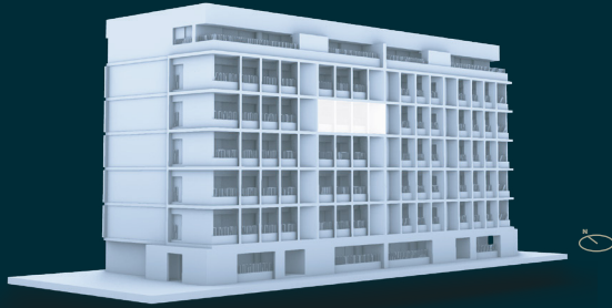
South - Front North - Back view