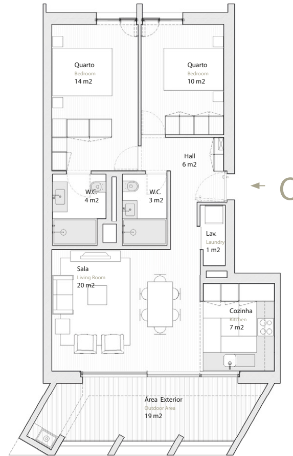
Vista Parque Green Park View

Estacionamento Parking 1 lugar (-1) Spot