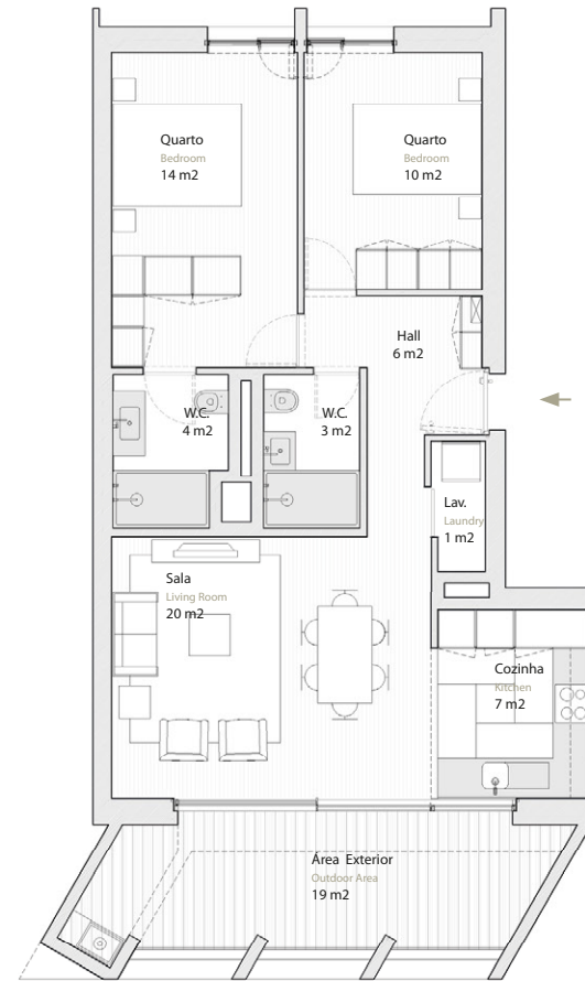
Vista Parque Green Park View

Estacionamento Parking 1 lugar (-1) Spot