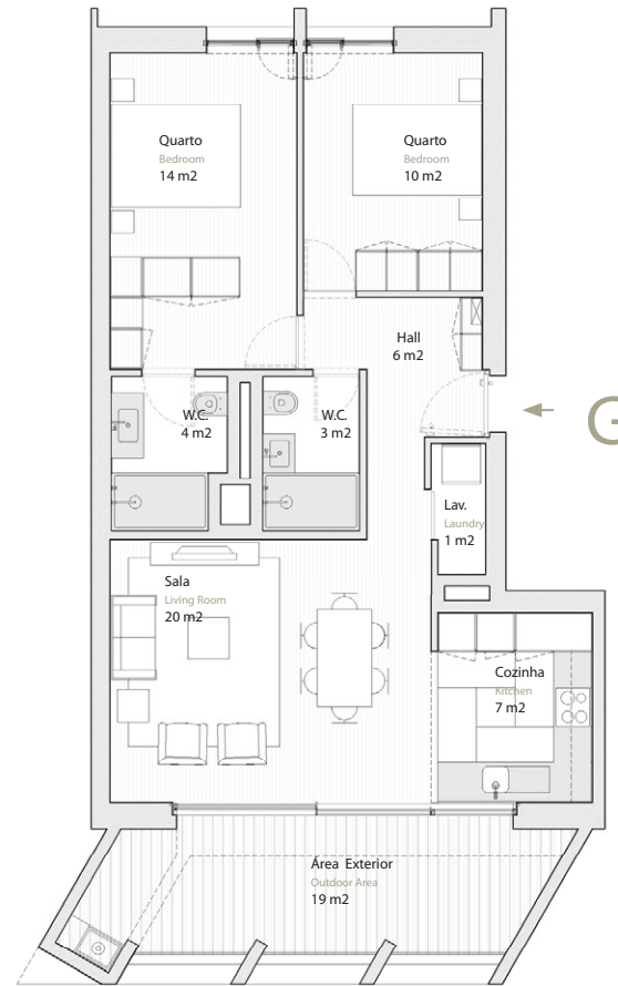
Vista Parque Green Park View

Estacionamento Parking 1 lugar (-1) Spot