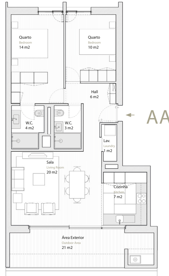
Vista Parque Green Park View

Estacionamento Parking 1 lugar (-1) Spot